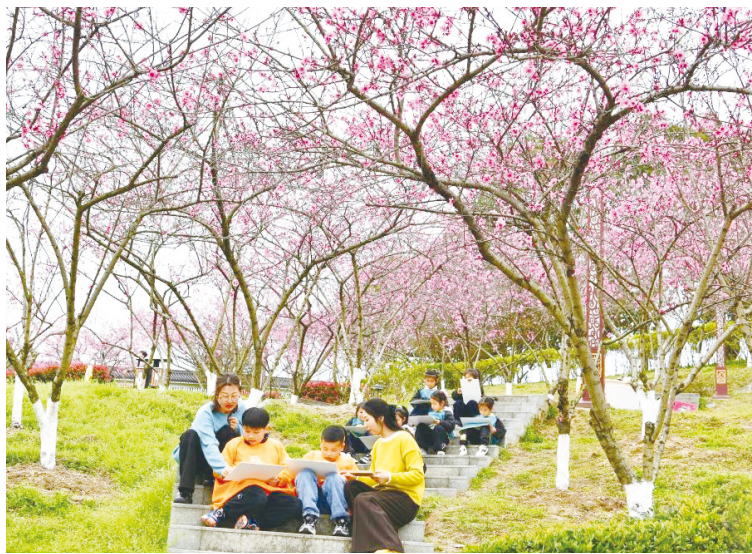
孩子们在湖北省宜昌市秭归县屈原故里文化旅游区练习画画。