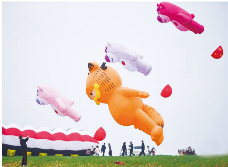
人们在河南省洛阳市新安县南李村镇乡村风筝嘉年华活动现场欣赏造型各异的风筝。