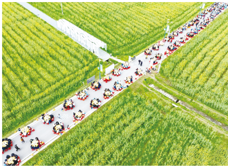
游客在四川省广安市广安区花桥镇油菜花田间吃坝坝席(无人机照片)。