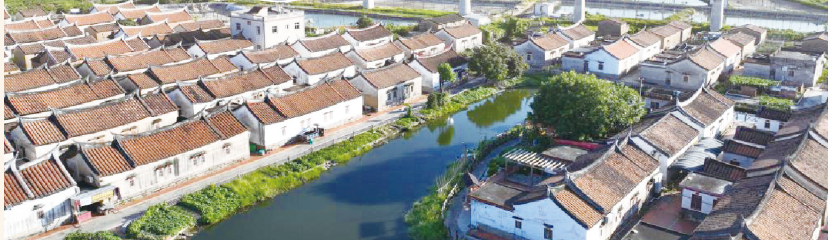
▲ 从空中俯瞰，河水如长龙玉带般紧绕埭美村。