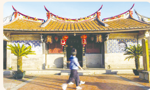
▲ 两名游客走过漳州龙海区东园镇埭美村古厝。