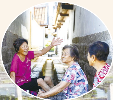
▶ 埭美村村民在古厝间乘凉聊天。