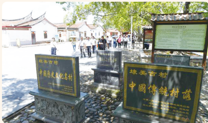
▲ 游客在埭美村内参观。