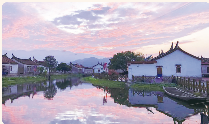
▲ 夕阳下的埭美水上古村景色