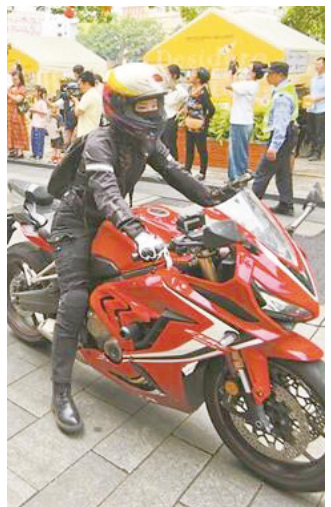
▲英姿飒爽的女“摩友”成为亮点。

记者从主办方了解到，参加此次巡游活动的“摩友”来自江门及周边珠三角城市。他们所骑乘的摩托包括巡航、仿赛、踏板摩托车以及超过50年历史的边三轮摩托车。除了一些国外知名品牌摩托车外，本次参与巡游的摩托车大部分来自江门大长江、珠峰、建雅等本土知名企业，充分展示了