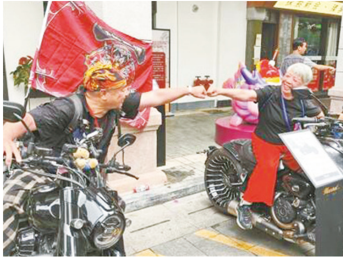
▲珍姨（中）与“摩友”击拳互表敬意。

巡游路线沿线，主办方还设置了丰富活动。在江门市文化馆门口，十五运会吉祥物“大湾区”与市民热情互动。在江门市博物馆长堤分馆附近的亲水平台，乐队表演轮番上演。在长堤历史文化街区，文创